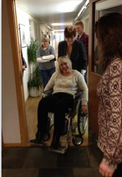
Kurs for kommunepolitikerne i Alta kommune, 2012