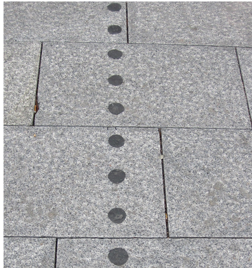
Mest diskusjon rundt ledelinje...