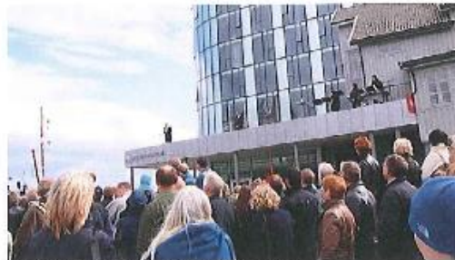
16.000 personer i Lofoten i april 2011.