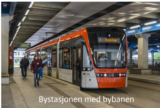
Bystasjonen med bybanen