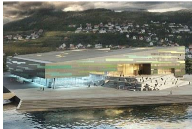
Amalie Skram vg. skole, Hordaland fylkeskommune og ADO arena, Bergen kommune