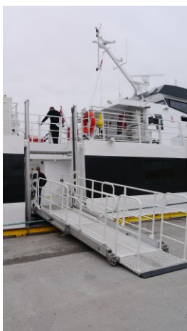
Universell utforming i Finnmark. Boreals løsning på ombord og ilandstigning på hurtigbåter i fylket. Løsninga har innebygd heis.