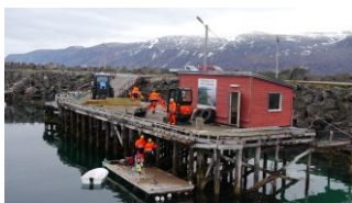
Sandland, anløpssted for hurtigbåt.