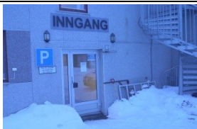
Hovedinngang kommunehuset i Loppa.