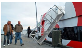
Universell utforming? Eksempel fra Troms.