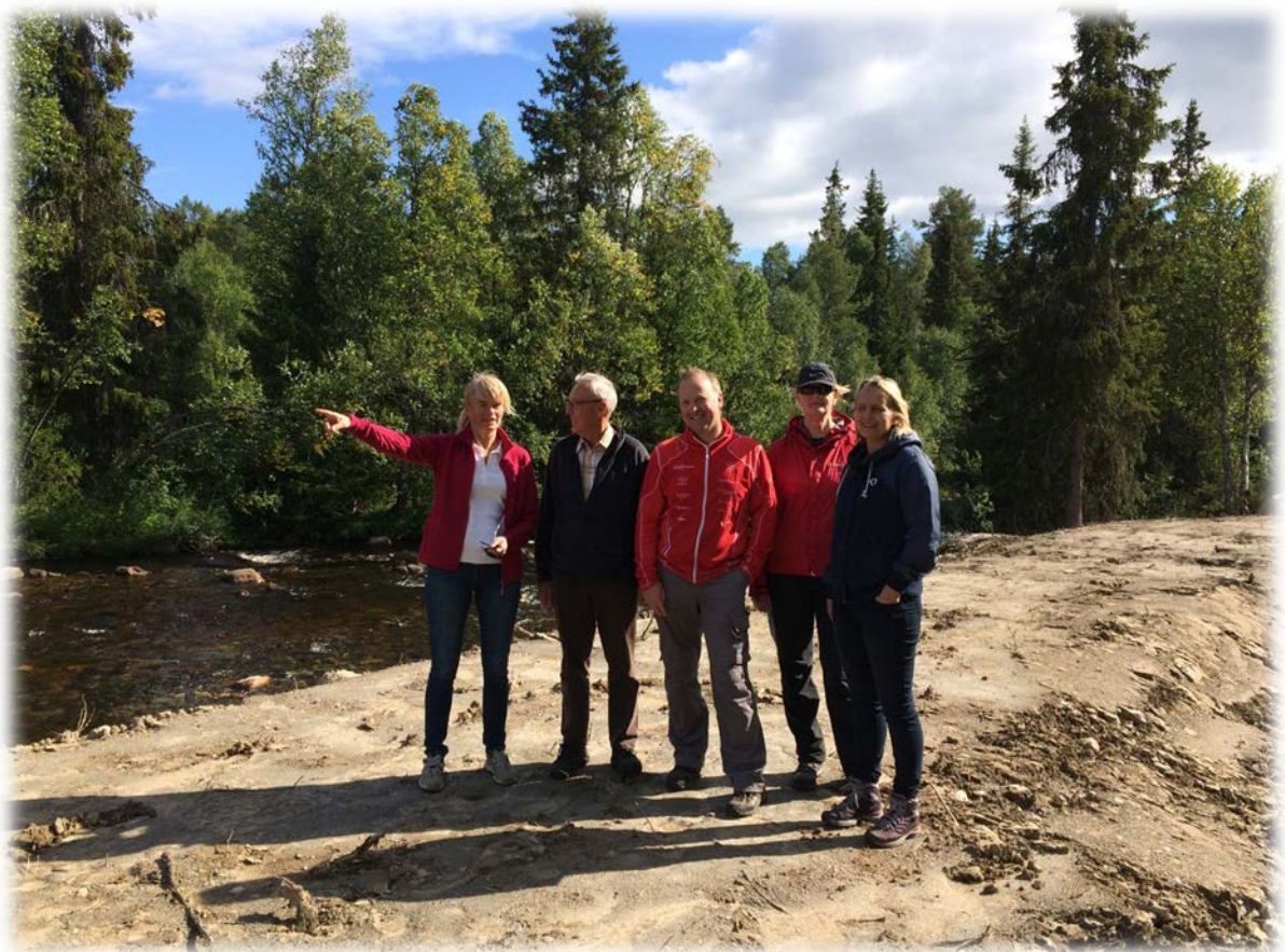
Synfaring av universell utforma turveg

Universell utformet turveg, Vinje kommune Rauland sentrum